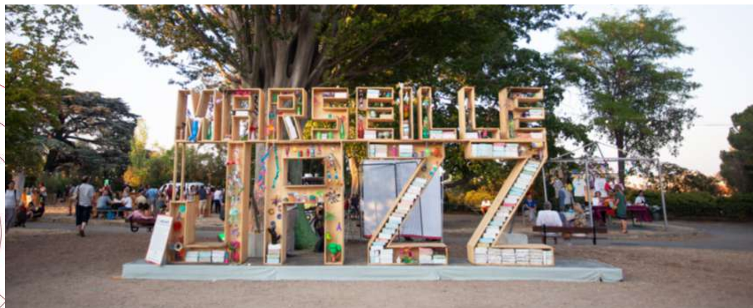
OEUVRE FINALISÉE DE L'ANNÉE 2022

PROJET ARTISTIQUE ET ÉCOLOGIQUE EN LIEN AVEC LE JAZZ : RÉALISATION D'UNE OEUVRE D'ART ET DE DÉCORATION LORS DU FESTIVAL AU PALAIS LONGCHAMP ET AU CENTRE DE LA VIEILLE CHARITÉ